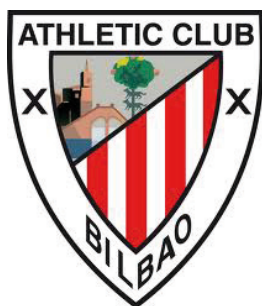
Athletic Club de Bilbao

“El Athletic Club, respecto a los servicios de Hostalia en relación al alojamiento de su sitio Web oficial, sólo tiene palabras de agradecimiento, tanto en cuanto al aspecto técnico, como al aspecto personal”